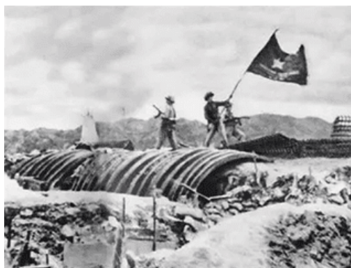
Viet Minh troops plant their flag over the captured French headquarters at Dien Bien Phu

Det är alldeles riktigt att protestvisan i första hand har kommit att förknippas med Frankrikes kolonialkrig i Algeriet 1954-1962. Faktum är emellertid att visan skrevs innan Algerietkriget bröt ut i november 1954. Visan framfördes våren 1954, mitt under slaget vid Dien Bien Phu, av Marcel Mouloudji , en av dåtidens mera kända vissångare i Frankrike och med algeriskt påbrå, om en får tro Wikipedia.