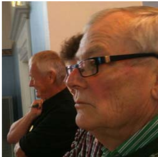
På ett annat och fredligare möte

Som väntat beslutade de borgerliga i Arbetsutskottet att våra yrkanden och reservationen inte skulle få gå med remissutskicket. Oppositionens ställningstagande ska alltså hemlighållas för remissinstanserna. Detta hemlighållande har fortsatt på kommunens hemsida. Där finns inte ett ord om att det råder politisk oenighet om programförslaget. Alternativet till de borgerligas urvattnade förslag ska förhindras att komma till allmänhetens kännedom. Kanske borde Miljö- och hälsoutskottet döpas om till Sekreta utskottet?