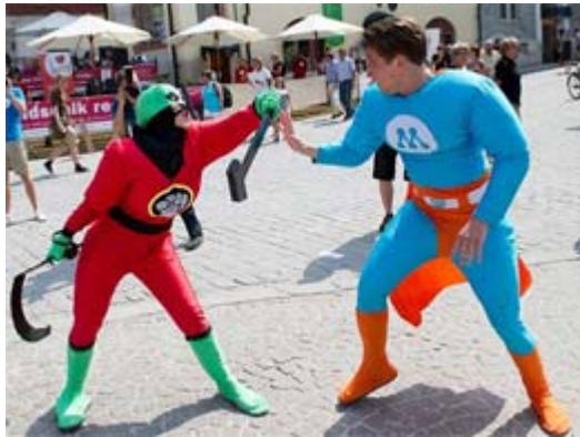
Sjöbo, Kivik eller Almedalen?

Vad tycker jag då om Almedalen? Ja man ser ju en del uttalanden om att det här är politikens Kiviks marknad, i regel uttalat av människor som inte tycker om Kiviks marknad.