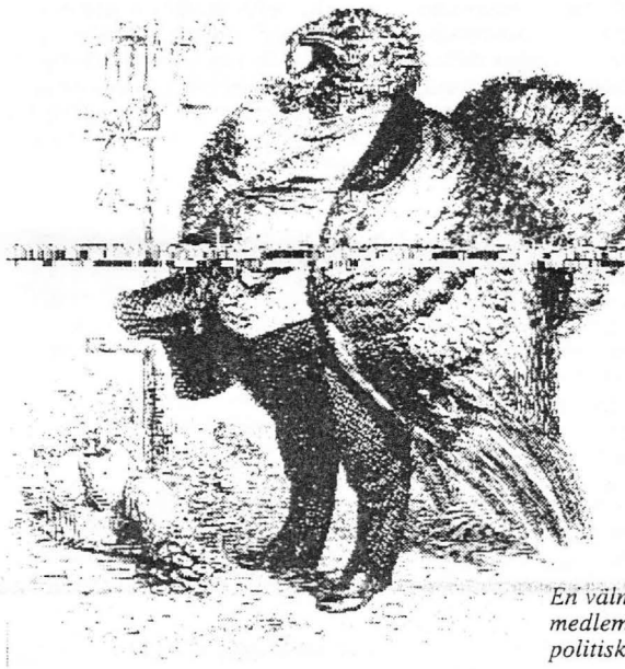
En välmatad medlem av den politiska klassen.