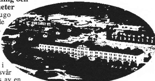
Den svenska garnisonsstaden: parti från Eksjö

Sverige finns i ett hörn av Europa med få regionala konflikter.