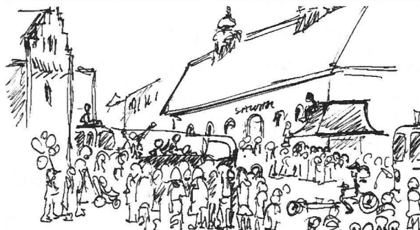
Karnevalen från partilokalens fönster