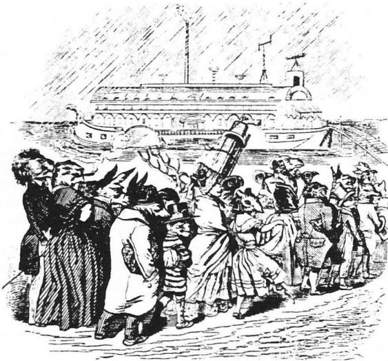
Gästade riksdagsledamöter debarkerar efter studie av brobygget.

Men nu är "Kristina" slutkörd och därmed de goda dagarna för Musikteatern och hotellet. Symfonikerna räddades med ett nödrop och för tillfället men Unga Teatern försvinner. Dramatikerna på Hipp lär inte undgå kraftiga nedskärningar. Det är smärtsamt att lägga ner en teater, säger Reepalu, men