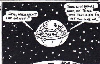
Hälsning från kometen