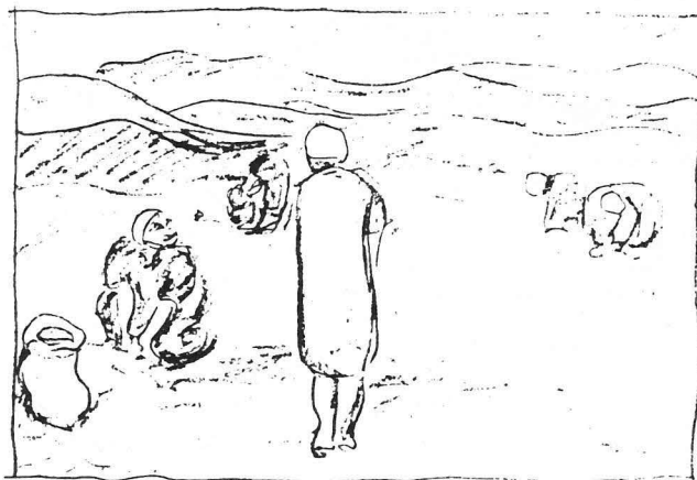
Lingonplockorskorp på Hallandsås efter oljemålning av Ester Almqvist 1928