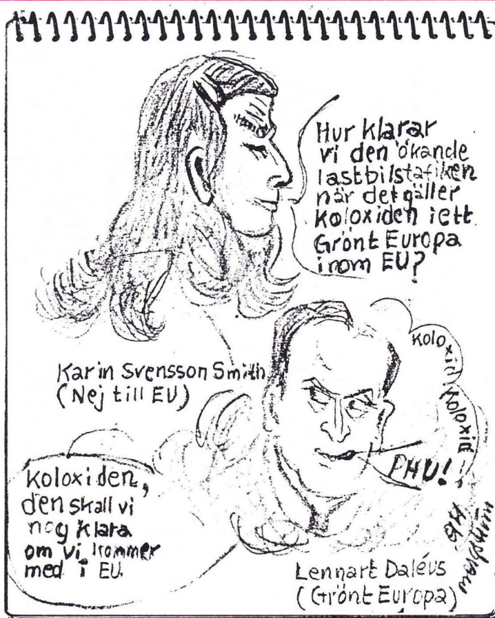
Tecknarrapport från Stadshallen av Göte Bergström