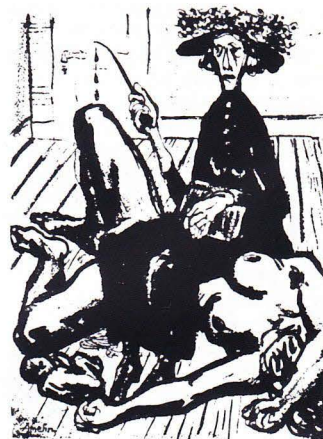
Sonden. Tuschteckning från 1934 av Albin Amelin.

östeuropeiska länder, är avskräckande siffror. Abort ska inte användas istället för preventivmedel. Men det är också en balansgång om man som i Holland ska lyckas med att nästan helt få bort tonårsaborterna genom att offensivt dela ut p-piller till alla skolflickor. 30 000 aborter om året i Sverige är onödigt mycket. Mer resurser till ungdomskliniker och rådgivning på skolor skulle kunna ge resultat. Det vet man efter långvarig verksamhet på Gotland.