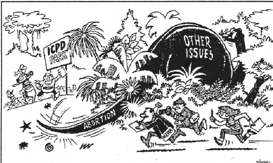
Abortfrågsagan dominerade uppmärksamheten på utvecklingsfrågornas bekostnad.