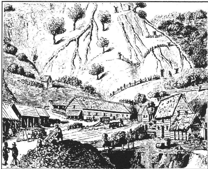
Sommarbild från ett äldre Kiruna. I förgrunden ett lappkapell.

Veckobladet är en sydsvensk lokaltidning. Rapporter från Kiruna prioriteras inte vid platsbrist. Därför är nedanstående bidrag något nattståndet.