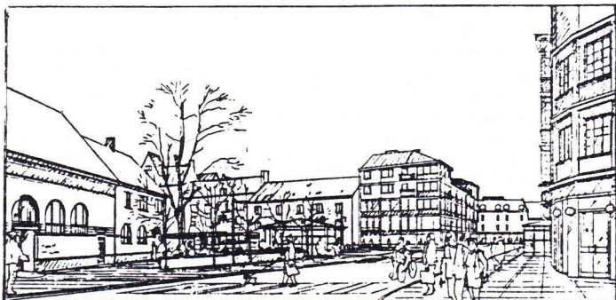
Restaurang 5:ans veranda t.h. får vi kanske aldrig uppleva igen...