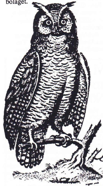
Har vänsterpartisterna blivit alltför kloka och ansvarsfulla?

Framtidsutsikterna pekar mot en skattehöjning på ca 1 krona, men det finns några osäkerhetsfaktorer, menar Roland. Många förvaltningar sparade under 1992 mer än de behövde. Kanske denna trend håller i sig? Det kan komma ändrade statsbidragsbestämmelser som gynnar Lund för en gångs skull. Det går kanske att få ut något av det vinstrika Energi-bolaget.