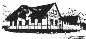
Gamla Tyrol i Folkparken 1975