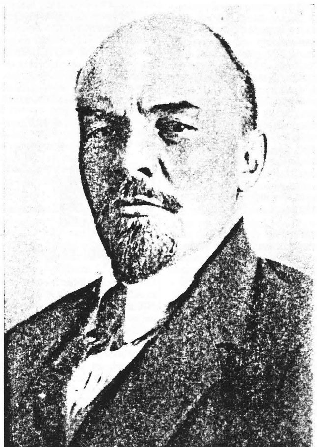
För tillfället utan mössa. Bilden hämtad ur Lenins Collected Works, som numera kan fås för vrakpris.