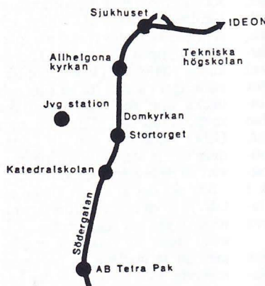
Spårvägens sträckning genom Lund enligt utredningen "Kollektivtrafik på rätt spår". Notera att den inte angör Lund C.

nomi som i första hand räknas i borgarnas Lund och Sverige. Och