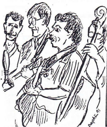
Panikorkestern Ve och Fasa, vänsterpartiets skifflegrupp, som roat och oroot på gatorna under valrörelsen, höll humöret uppe under valvakan på Fakiren. Teckning Göte Bergström.