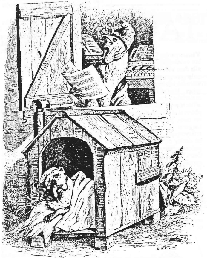
Högern utropar den nya tiden medan vänstern slött slickar sår