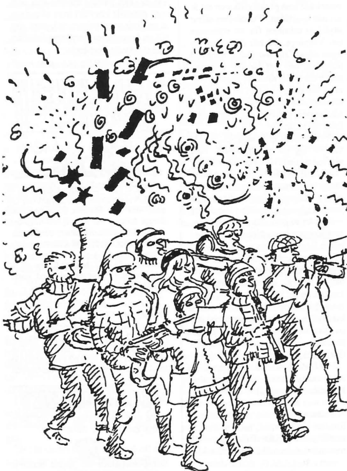
En mycket civil blåsorkester. Vi har lånat en teckning som Cecilia Torudd gjort i ett annat sammanhang.

Är du inte med i Röda Kapellet än mentycker att detta låter lockande? Det är bara att skaffa ett instrument och börja öva.