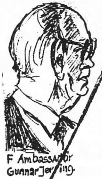
F. Ambassadör Gunnar Jarring