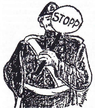
Bergström är namnet på tecknaren - inte på polisen.

Det blir emellertid fortfarande möjligt att köra bil till stan när man verkligen behöver det och är beredd att betala de höjda p-avgifterna. Bussar, cyklar och fotgängare får lättare att ta sig fram. Det skapas underlag för en utökad kollektivtrafik. Stadskärnan blir alltså mer tillgänglig - en majoritet av Lundaborna har ju tillgång till bil. Men framför allt blir det trevligare att vistas där. Vi får helt