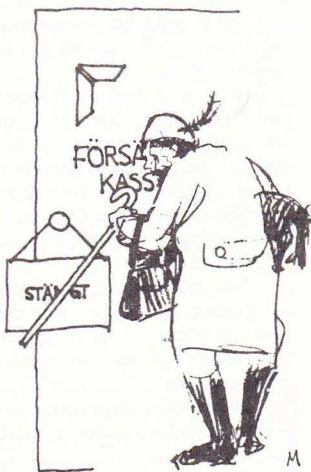
Regeringens sparpaket ser ut att drabba sjuka och pensionärer.