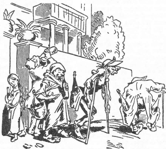
Billigt vin och öl i östra Europa.