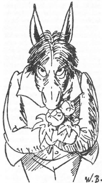
Mindre lyckad fastighetschef.

Inför detta kan man vara filosofisk och generös och säga att Lund har så mycket ändå. Man kan kanske unna Helsingborg, Landskrona, Ystad eller Kristianstad (de svarade i tid) att få det här kansliet.