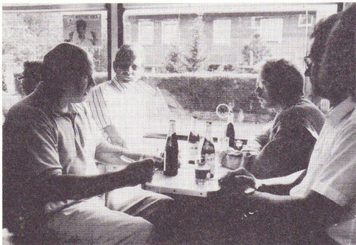
En illustration till artikeln i förra numret av VB: En kall öl i restaurangspårsvagnen mellan Duisburg och Düsseldorf avnjuts här av några välkända lundapolitiker.