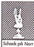
Schack på Norr

RÖDA KAPELLET sö 4.3 rep 18.45 i Kapellsalen. Rep för röd spelning "Han som blev över" i Limhamn 31 mars. Repetitionslista för repeligen på Idaröd 10-11 mars: repertoaren för "Han som blev över": 175 Isabella. 190:2 Arbetets söner. 194 Ätta och en halv. 198, 199 Kagel marsch 3 o 4. 210, Jag har bott vid en landsväg. 217 Sexton ton. 218 Var blev ni av?. 219 Sicilliana. 220 Epilog. 221, Somliga går med trasiga skor. Utan nr: "Malmö-Limhamn". Samt "Zwischen spiel" (som ersätter 213). Dessutom repar vi för spelning 17/3 i Malmö på 155 Nkosi sikelela. 156 Sesebacha och lthemba o Ewethina. Vi repar också de nya låtarna 223 Cirkusmarsch, 224 Känslans partisaner och 225 Sängen om mervärdet (obs numren). Notkopier kommer att finnas på söndagens rep samt på Idaröd.