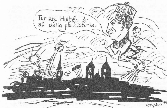
Vad Karl XII från sin himmel åsyftar är hans tid som flykting i Turkiet efter nederlaget i Poltava.