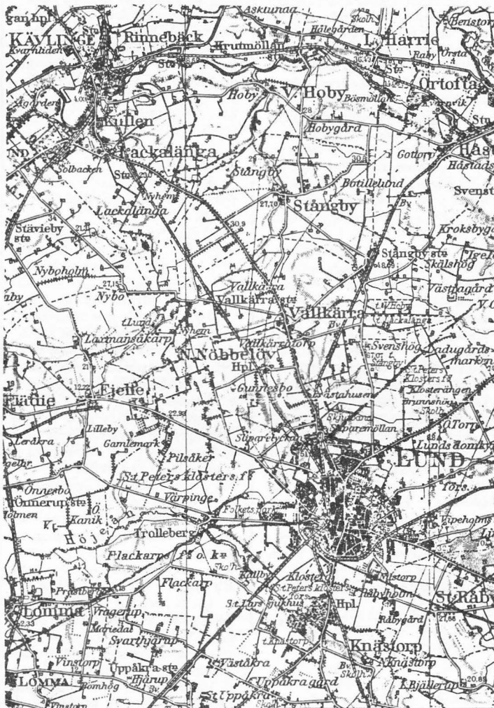
Generalstabskartan ovan är från den tid då järnvägen mellan Örtofta och Kävlinge ännu var i drift. Utredningen vill ha banan åter.

intryck av en ny dansk tågkonstruktion som heter IC3, och som bland annat utmärks av att olika sektioner kan kopplas samman snabbt och automatiskt.