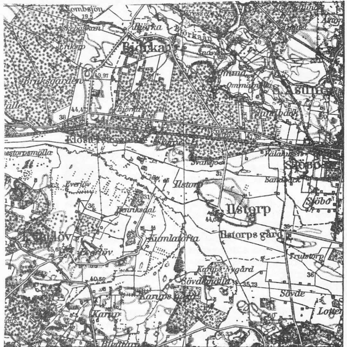
Enligt avtal med Rikets allmänna kartverk tryckt av Generalstabens litografiska anstalt, Stockholm 1947.

Kommer därtill att det på trettitalet fanns nazister i Sjöbo, omvitnat av skönlitterära författare som Hans Alfredson och Nils Kellgren. Forskare och reportrar har lagt ihop 2 + 2, lantlig efterblivenhet plus fascistisk tradition, och fått en