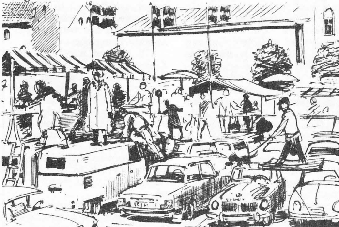
Var folkhemsdyllen bara ett socialistiskt knep?

Per Nyström har nyss berättat i en intressant artikel att Tage Erlander mot slutet av sitt liv menade att folkhemmet (och folkvagnen?) aldrig var något mål i sej. Det var tänkt som ett instrument för att förverkliga socialismen, men sen gick nånting snett.