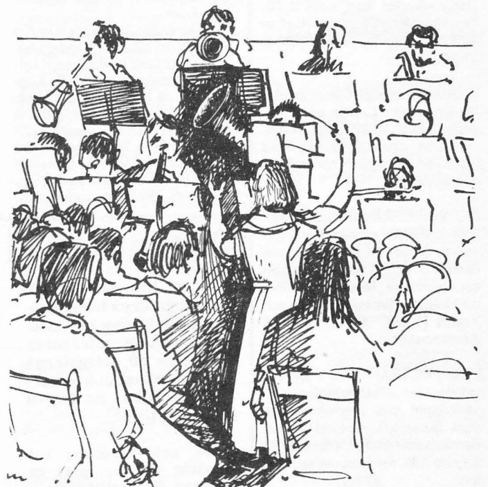
Känd blåsorkester repeterar kommunistisk kompositör.