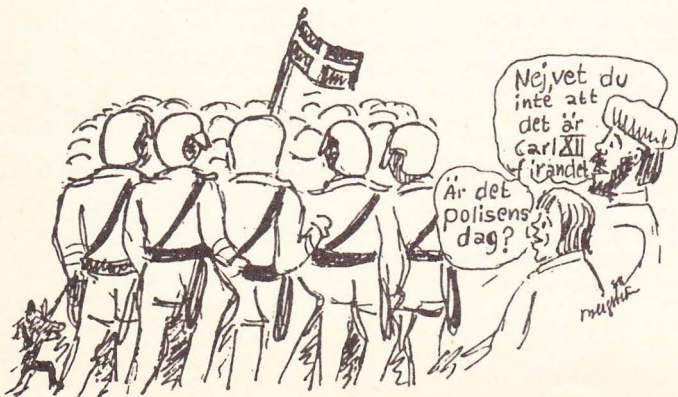
Apropå 30 november igen. Det var inte stort mer än polisryggar som syns utifrån.