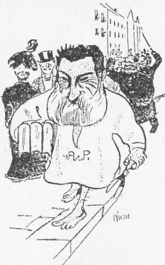
Palmborg missar Palm.

Varför står det ingenting om Armaturfabriken (det industriella Lund ute på Ideon har en