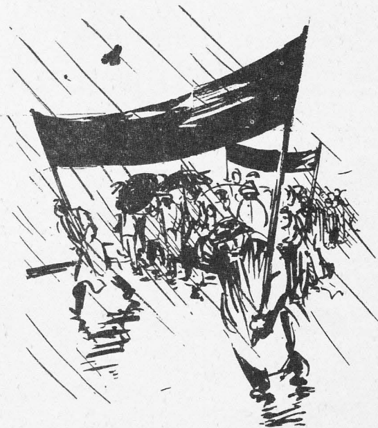
Regnvatten på god väg att bli dagvatten.

PS I texten ovan används det ovanliga men praktiska ordet "vildnad". Det görs ibland även i Sydsvenskans naturspalt, men där brukar det övernitiska korrektivet rätta det till "vildand". Undrar hur det går här i VB.