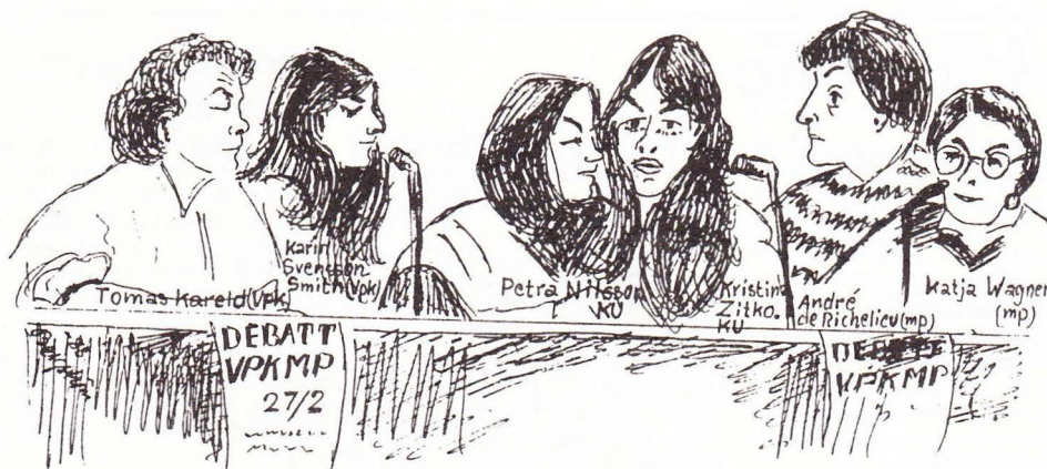
Panelen, fångad av Göte Bergström. Debatten uppmärksammades bl a i en ledare i Sydsvenskan.

beredd att sopa undan varje rest från gårdagen.