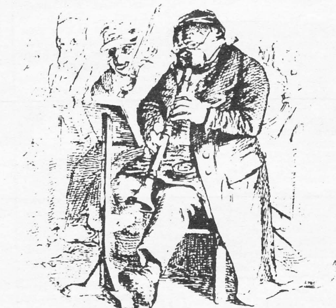
Kommunistisk medeltidsorkester med adertonhundredtalsinstrument.

på plats under Kulturnatten och förevisa ruinen och medeltidssamlingen. S:t Drottens var en stor kyrka och ruinkällaren är lång. Flera aktiviteter kan pågå samtidigt. Själva ska vi delvis hålla till ute på den medeltida gatan Kattesund.