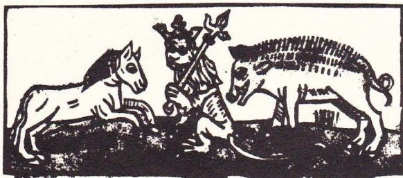
Medeltiden blir utgångspunkten för Lunds Kommunistiska Blåsorkester på årets Kulturnatt.