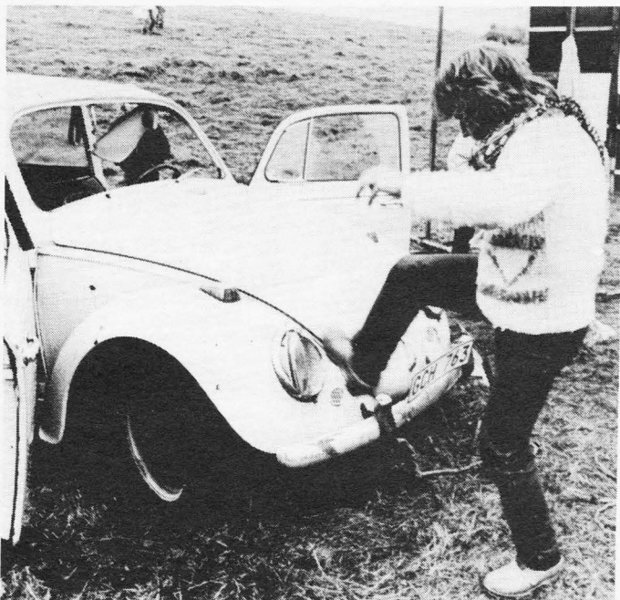
"Bilismen måste stävjas genom lagstiftning, ekonomiska pålagor och fysiska hinder."

En smula slösaktiga är vi när det gäller busstaxorna. Här vill vi