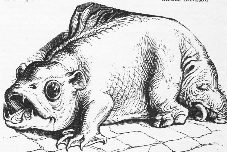
Vpk — ett parti med (minst) två huvuden?