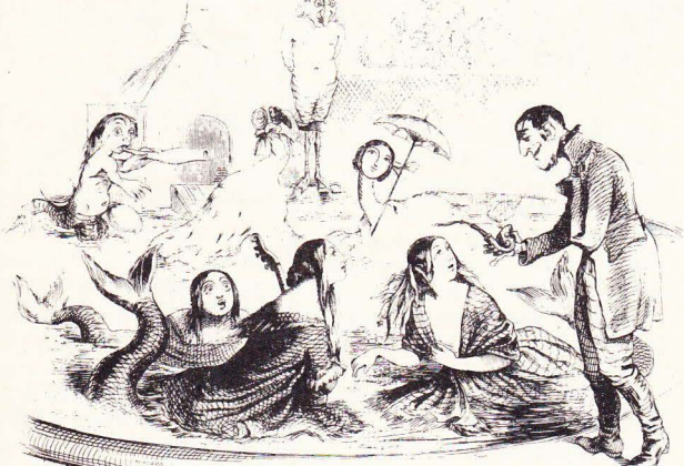
Det berömda bubbelbadet vid Högevall.