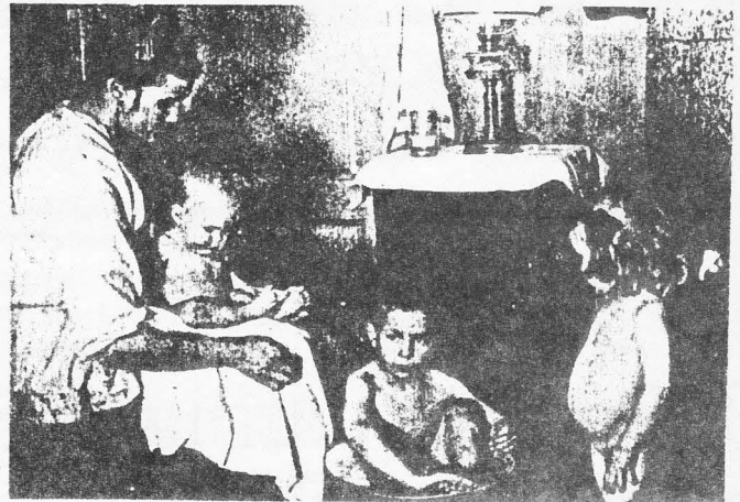
...hushållsarbetets ledning och fördelning

- Ompröva din politiska inställning. Du har ju ändå märkt på dig själv hur dina gamla ståndpunkter liksom inte håller i det moderna informationssamhället. Och nog har du väl tröttnat på den eviga moralismen bland vänstermänniskorna i din umgängeskrets. Det var säkert bara slentrian att du hamnade i vänstern, nu är du vuxen och har vidgade vyer och