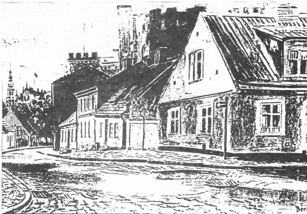
På målningen ser vi St Annegatn, i mitten av bilden ser vi huset som inrymde Vpk Lunds första partilokal. I lokalen skrevs, stencilerades och adresserades också det första numret av VB. När Vpk flyttade ut så såldes huset till en privatperson som rustade upp huset till bostad.