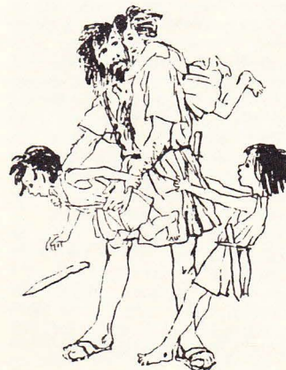
Kamrat Jesus gillade barn.

Samtliga strategier misslycka- des således i det viktiga målet att erövra den nationella självständig- heten. Det finns alltså ingen hi- storisk lärdom att dra av detta skeende. Men å andra sidan kom nederlaget på korset att leda