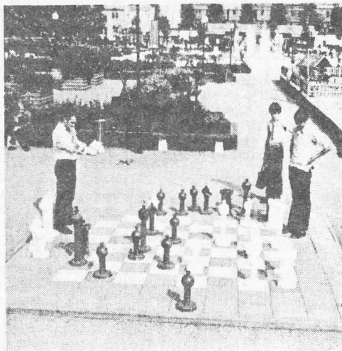
Visst behövs det uteschack i Lund också.