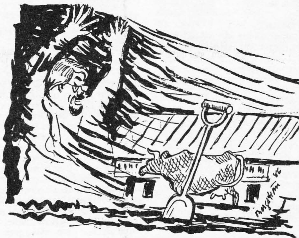
Nu är första spadtaget taget för Kulturmejeriet. Men en ond ande svävar över bygget.....