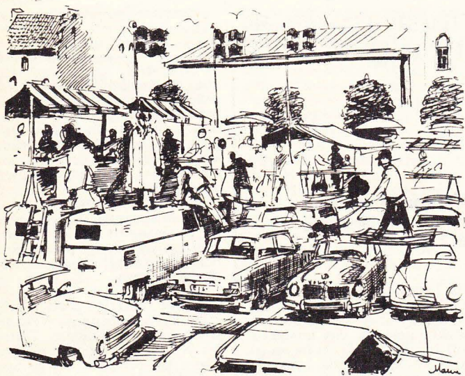
—Bilfri innerstad på sikt, anser vpk.

Vpk Lund har nu tagit ställning till centrumutredningen. Det sker genom ett förslag till fastighetsnämndens yttrande över utredningen »Trafiken i Lunds centrum».