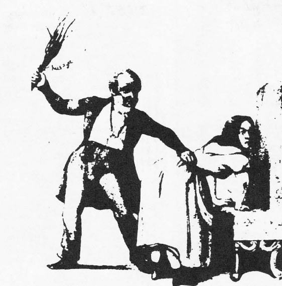
Förlegad strafform inom patriarkatet

Efteråt sågs kvinnor samlas i klungor i Lundagård, glada och inspirerade och tända på en diskussion. Som Sussane Brøgger uttryckte saken: "Germaine Greer skapar fruktbar förvirring". Vi var några som bänkade oss till eftermiddags på Storkällaren och tog upp