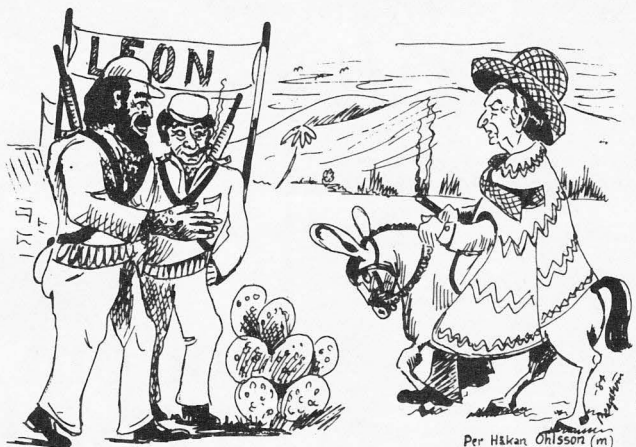
Per Håkan Ohlsson (m)

Om myndigheterna i Nicaragua är av samma mening som Lunds kommunfullmäktige så kommer en vänortsrelation upprättas mellan Lund och en stad i Nicaragua.