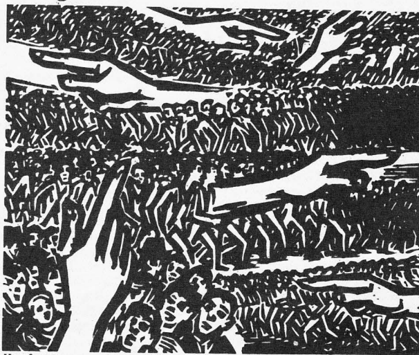
Konferensen om ekonomi & sysselsättning i Malmö 1983