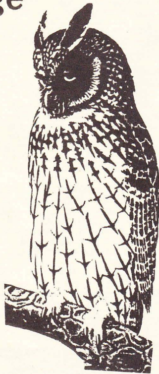
Kvarteret Ugglan får ett fritidshem

Det medeltida märket räddades genom att vpk kompromissade med moderaterna på så vis att fi-