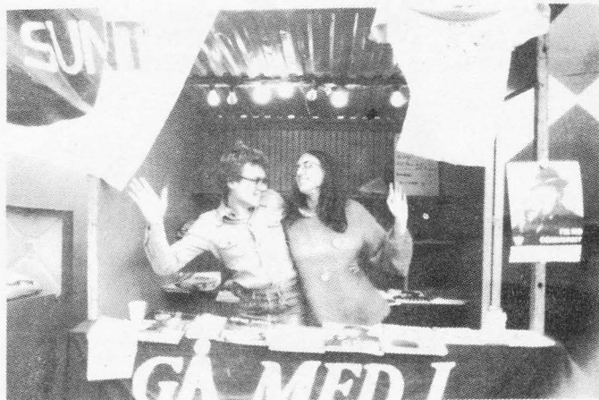
HÖSTFESTEN ädla känslor föder . . .