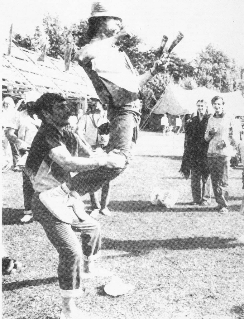
HÖSTFESTEN - en upplyftande tillställning . . .