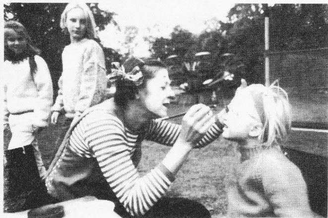
Man blir som förvandlad på HÖSTFESTEN . . .