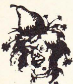
Kjell Dahlström (mp)

—Jag tycker så innerligen synd om de tjusiga ungdomarna.