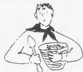
KÖKSFILOSOFENS REVOLUTIONERANDE RECEPT

Sedan lägger man i ett helt urtaget och sköljt får med ull och allt. Fåret skall vara saltat inuti och gärna i snitt i bogarna. Magen fyller man med potatis och krävan med ris, ett par paket. När detta är gjort, och färmagen igensydd,