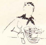
KOKSFILLOSOFENS REVOLUTIONERANDE RECEPT