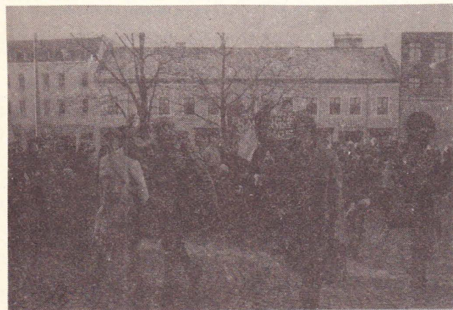
Några av VPKs fullmäktigeledamöter anländer till sammanträdet.

De besparingar som samhället, i synnerhet kommunerna, kan göra genom flerbostadslägenheter med hyresrätt, kunde användas till att kompensera hyresgästerna för de senaste årens orättvisor.