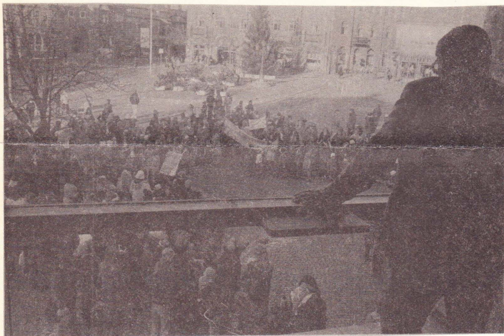
Utanför stadshallen genomfördes minst tre manifestationer, varav den största protesterade mot de fortsatta nedskärningarna inom barnomsorgen.

Vid Lunds kommunfullmäktiges budgetsammanträde förra torsdagen och fredagen röstades som väntat det borgerliga budgetförslaget igenom. Flera hundra personer hade emellertid samlats för att demonstrera mot olika punkter i detta förslag.