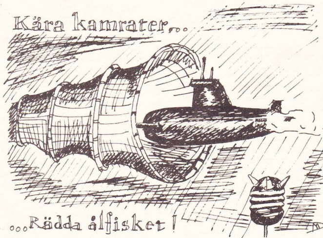
Ubåten Hammaren och Skäret på väg in mot Sverige. Upptäckt av svenska fiskare. Slutsatsen är klar: Mer pengar åt fiskerinäringen!

— Jag hade tagit utfästelserna på allvar. Det är jobbigt att bli be-