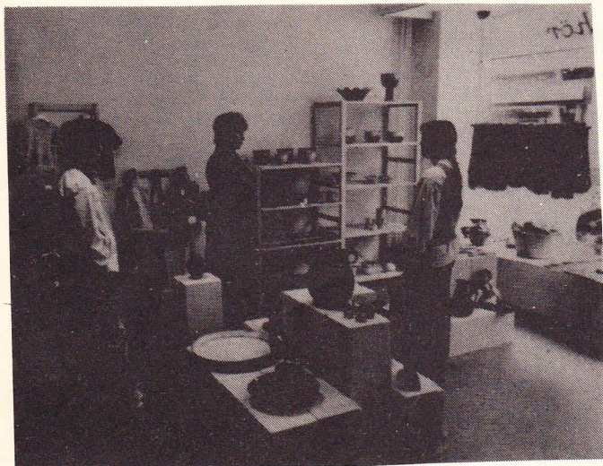
Interiör från Skånekrafts utställningslokal och affär