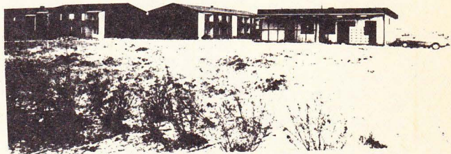
Här på ödetomten bredvid Konsums 10-åriga startbutik skulle Fagott huset ha byggts.

Ett annat skäl till att Fagott huset bör byggas är att Konsums Servusbutik annars är hotad. Den är sedan ett årtionde inrymd i en provisorisk barack, och drivs på dispens i väntan på permanenta lokaler i centrumhuset. Om inte det bygget blir av är det risk för att Konsumbutiken kommer att tvingas upphöra, och den delen av Ö Torn blir helt utan butik.