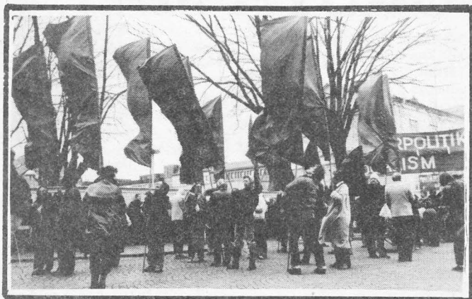
»fanorna fladdrar och vinden är svår/ när vänstern på gatorna går»